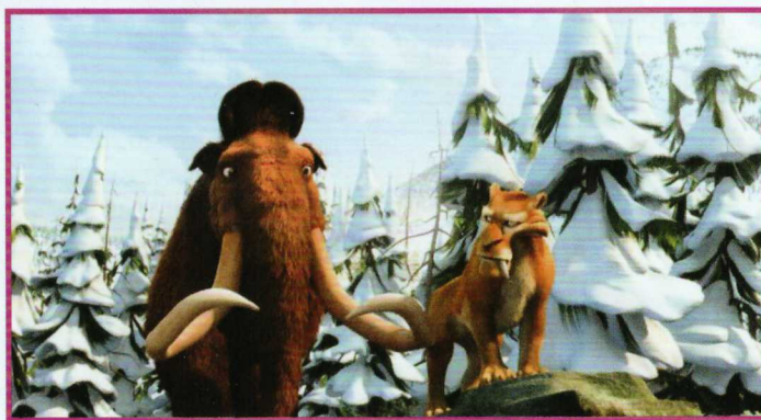
Immagine dal film d'animazione "L'era glaciale"

Il "dono arcaico", infatti, è un dono obbligato e quindi reciproco, mentre il "dono moderno" è gratuito, unidirezionale.